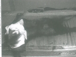
完全な場合、遺棄人に出入りされることも。プライバシー保護のため写真には住所等は削り取った

孤独死を防ぐためには... 孤独死を防ぐためには、孤立を防ぐことが重要です。孤立を防ぐためには、定期的なコミュニケーションを取り、周囲とつながりを持つことが大切です。また、必要に応じて専門機関やボランティア団体のサポートを受けることも有効です。