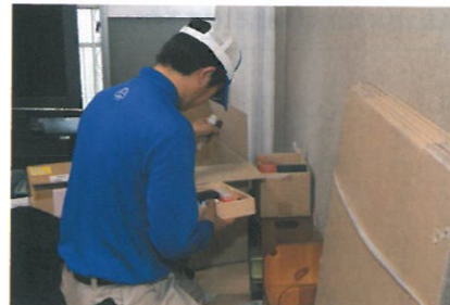
思い出の品と思われるものは、大切に分別しておき、後で遺族に確認・判断をおく