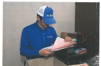
書類など、廃棄してはいけないものがないか確認し、手早く分類。みるみる部屋を片付けていく