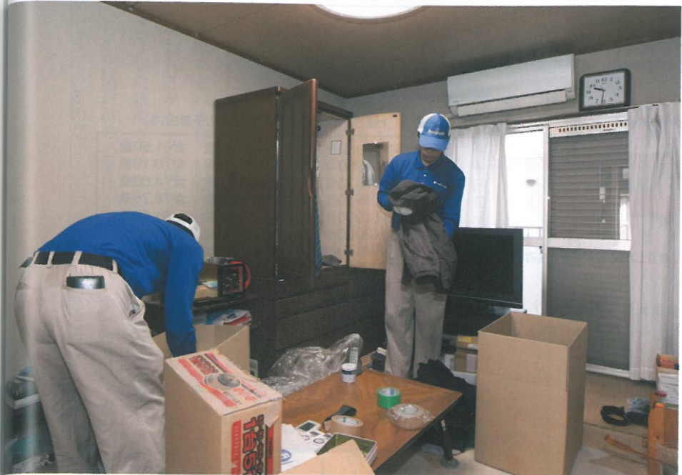
貴重品などがなく、遺族のチェックを受けてから、リサイクルか廃棄かを判断しつつ、箱詰めを開始

人が一人亡くなれば、故人の生きざまを語るたくさんさんの遺品があとに遺される。それらをていねいに整理してくれるプロの存在は、遺族にとって頼もしい限りだ。「キーパーズ」では、遺品は「ゴミではない」という考えをもち、遺品整理サービスを提供している。