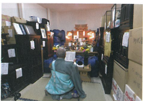
故人が生前大切にしていたものをただ捨てるのは…という人には、僧侶に供養してもらうサービスも

積に訪問し、遺品の仕分け、搬送、掃除、不用品の処分など、ひとつの業務を遺品整理のプロの仕事として行っていく。不動産の処理や相続に関する相談のサービスも始め、トータルで安心して任せられる遺品整理のパートナーを目指している。新サービスのひとつにある「クーパーズ」は、自分の遺品を確認し、残すものと処分するものを分けたりする事前整理サービスである。遺品整理と同様に自分や家族ではなかなか片付けられない長年にわたって蓄積された荷物を整理し、これからの人生をすっきりと暮らすことを提案している。