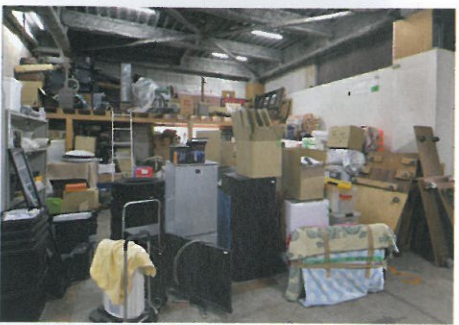
ものを無駄にせず、まだ生かせるものは生かすという考えで、リサイクルできるものは買い上げてくれる