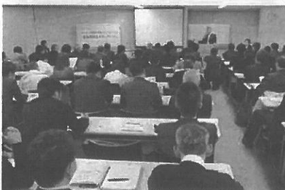
満席となった会場

も予想され、35年には約40%に達する見込みだ。同氏は、孤立死や徘徊、性(社会的)孤立リスクが高い傾向にあると指摘し併せて、厚生労働省ではこうした状況を受けて、民間事業者と連携して孤立死防止対策を推進しているとの説明。住民や事業者が要支援者の異変に気付いた場合にその情報を確実に市に届けられるよう専用の連絡窓口を新設し、地域レベルでの見守り活動を実施している大阪府豊中市の例を挙げ、「孤立のリスクは高くなってしまっている。一方、事故や病気による孤立死は告知義務範囲などに法的な定義はないものの、死因や人工の大量発生などを理由に近隣住民が引越してしまいうるリスクがある。同氏は、