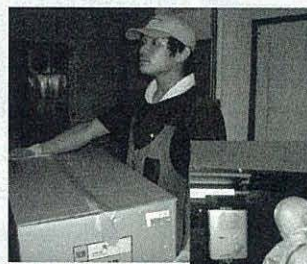
遺品は不要なものやリサイクルできるもの、遺族のもとに届けるものと、細かくテキパキと分類。

料金/すべての不用品を買い取り後、作業費及び人件費を差し引いた金額を請求。無料見積もりあり。 ☎: 0120-754-070 (10時～20時) メール: info@keepers.co.jp HP: http://www.keepers.co.jp