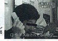
同じカツラでも分け目を変えるなどして、そのつどふさわしい容貌を演出している。