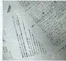
友人代表や主賓など、依頼された役柄に応じて手けたスピーチも数知れず。事務所では過去の原稿が山積み状態。