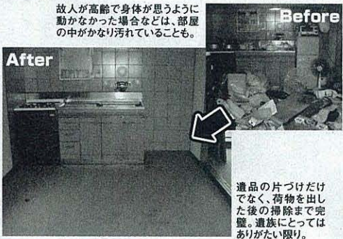
故人が高齢で身体が思うように動かなかった場合などは、部屋の中がかなり汚れていることも。