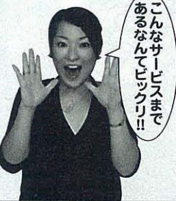
こんなサービスまであるなんてビックリ!!